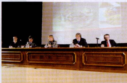
Panel: Empresa y Sociedad: Transparencia para un mercado responsable.